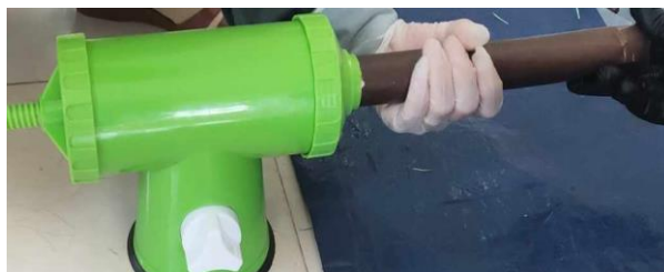
Hình 2. Đóng gói các mẫu thuốc nổ nhũ tương.