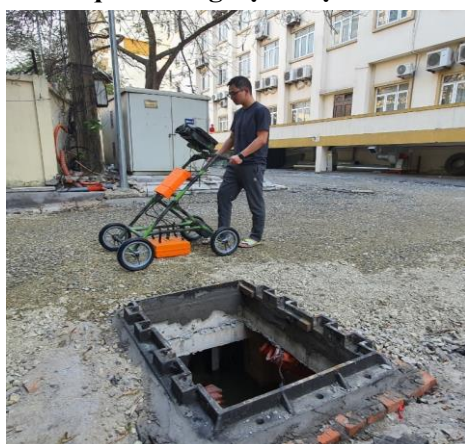
a) Thử nghiệm ra đa GPR trên thực địa.